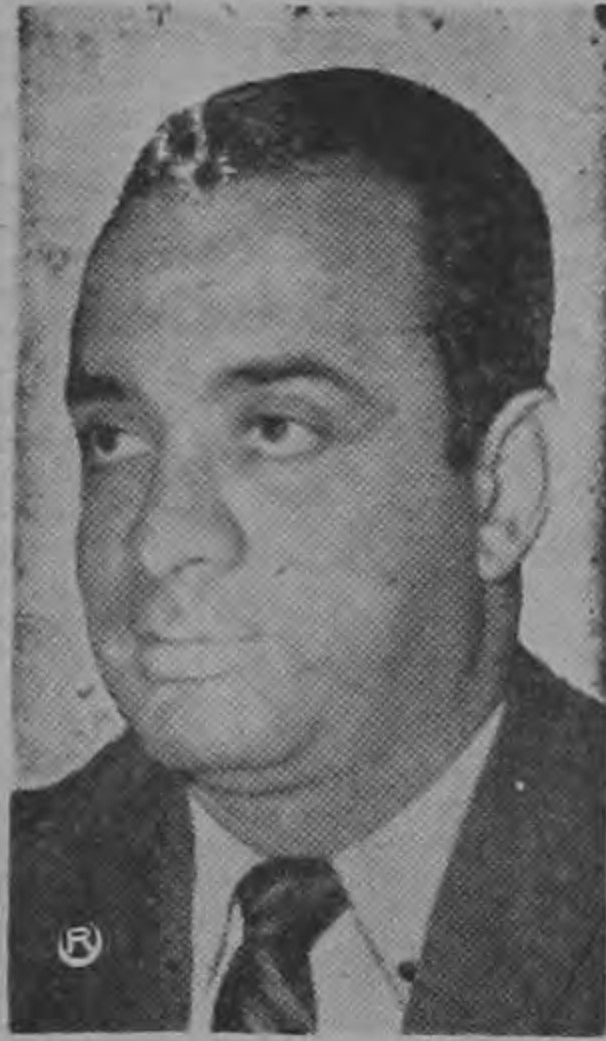
... Cancellor ODUBER...

Un sensacional comunicado expidió ayer la Cancillería revelando apoyo del Gobierno para que se examine la denuncia que entidades cívicas del Paraguay presentaron ante la OEA por violaciones a los derechos humanos en dicho país. Reitera Relaciones Exteriores validez para el principio de la NO intervención. Pero también el Gobierno de Costa Rica aboga "porque se cumpla el no menos sagrado prin-