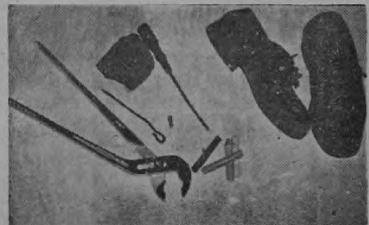
HERRAMIENTAS Y EVIDENCIAS fueron mostradas por los detectives ayer a la prensa. Hay unos tubitos de plastilina con que los asaltantes tapaban las juntas de las cajas de seguridad para volarlas sin mucho ruido. Los zapatos son del jefe de la pandilla.