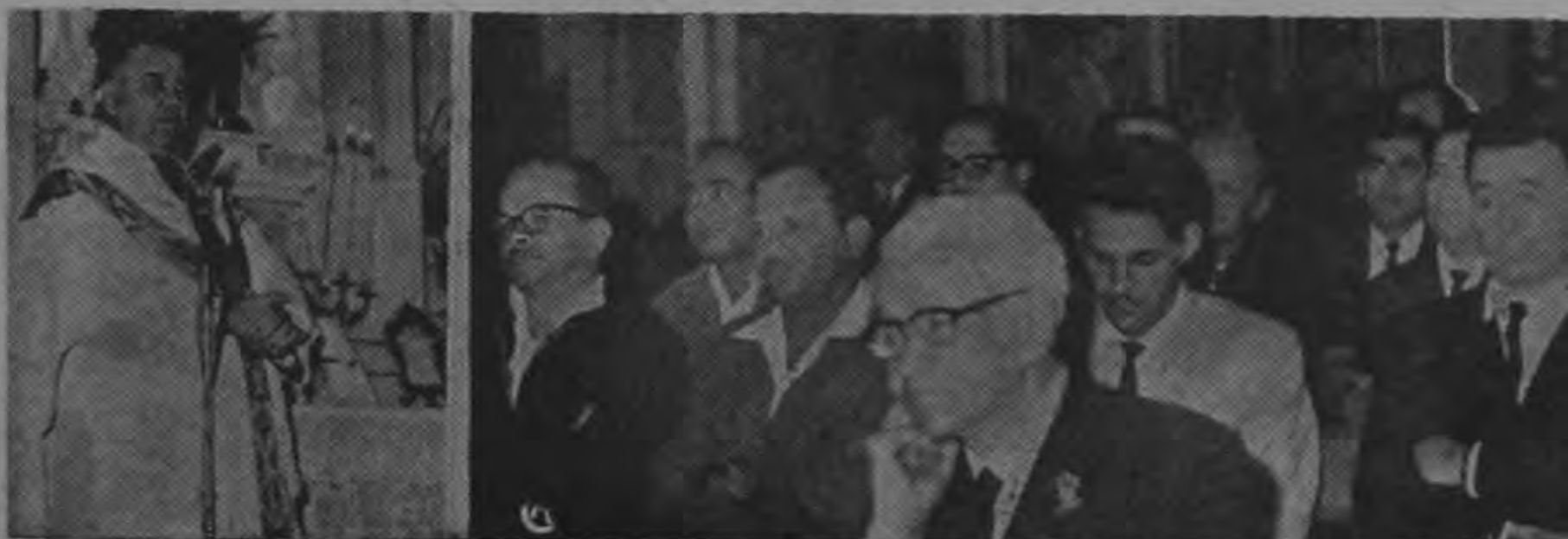
FIESTA CATOLICA DE LOS PERIODISTAS: —