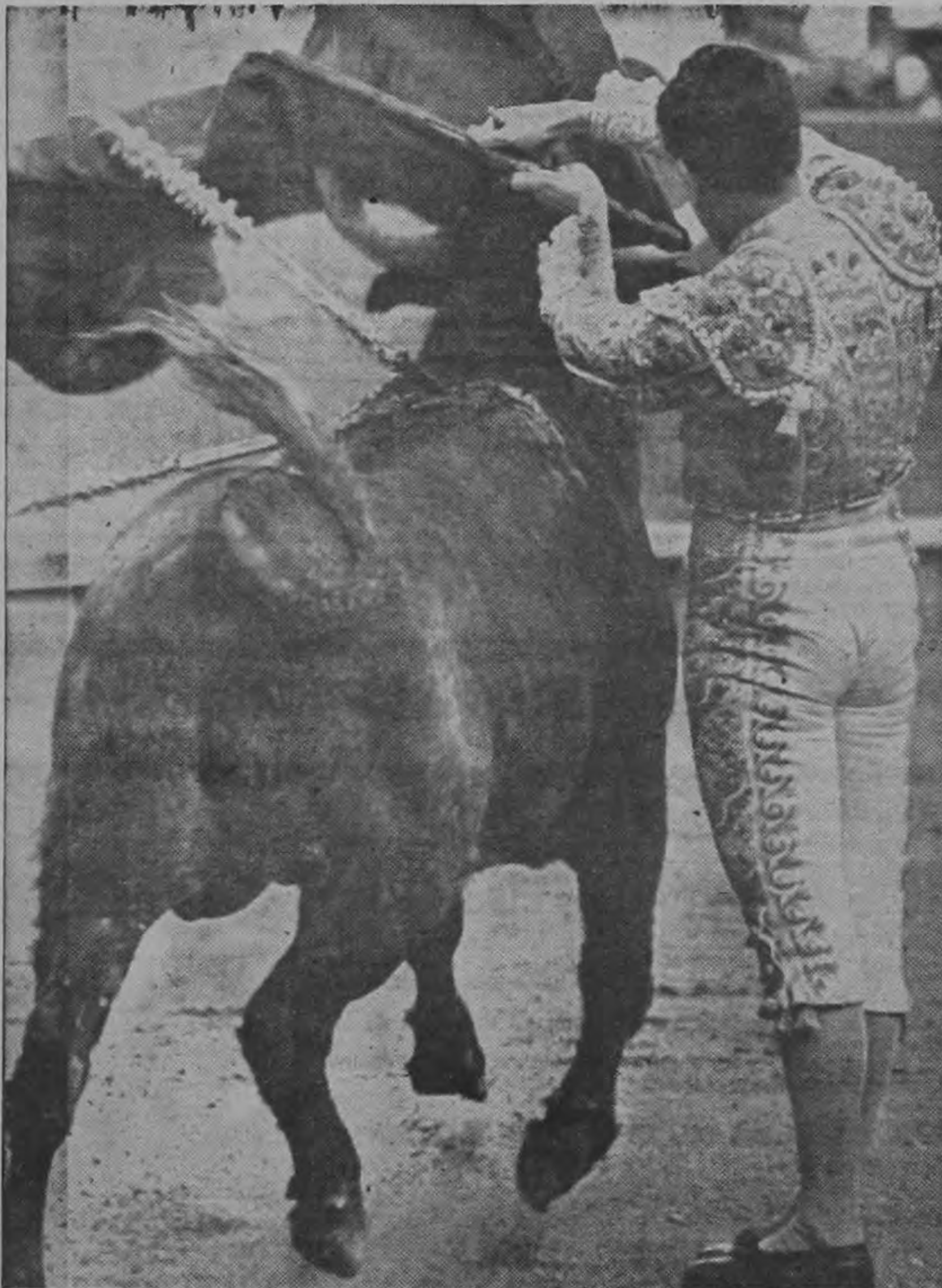
Este es RUBEN NIETO, magnífico torero mexicano que actuará el próximo domingo 3 en la corrida de inauguración de la temporada

Primera Gran Feria Taurina en San José, Costa Rica!!